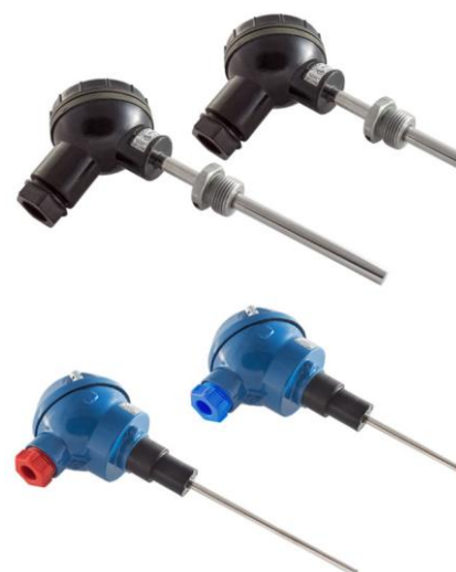
и) комплекты термопреобразователей сопротивления КТСП-Н