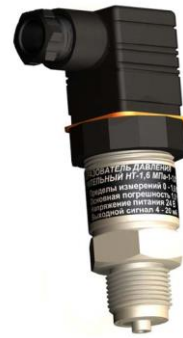
м) преобразователи давления НТ