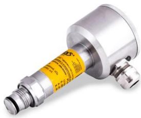
р) преобразователи давления РС-28