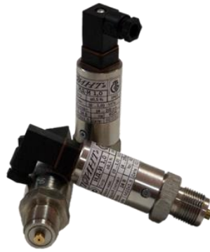
л) датчики давления ИД