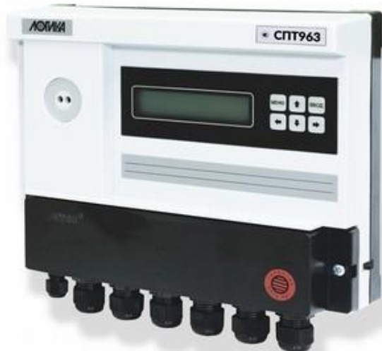
а) тепловычислитель СПТ963