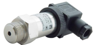
п) датчики давления малогабаритные КОРУНД