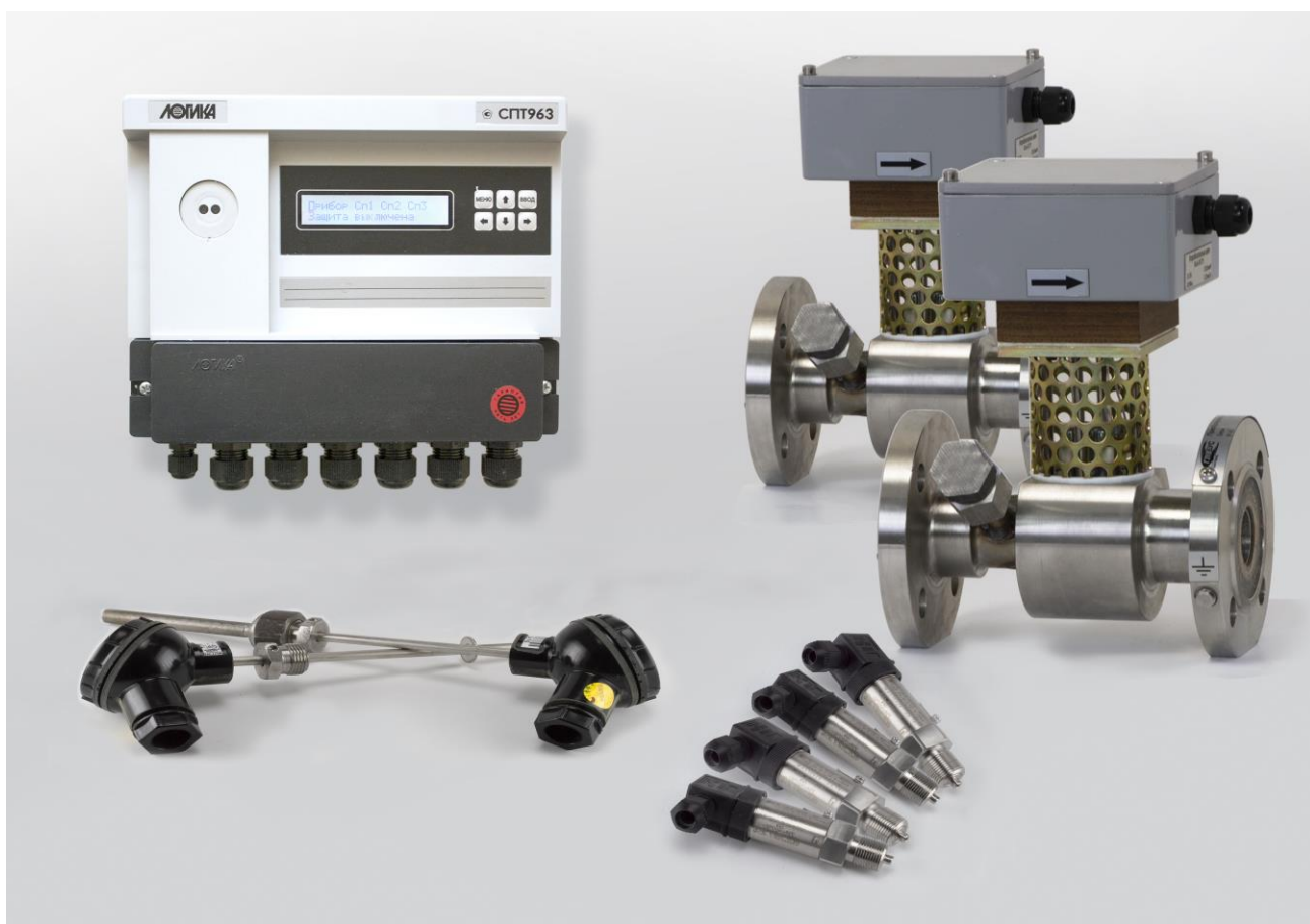
Рисунок 1 – Общий вид теплосчетчика Ирга-РВС