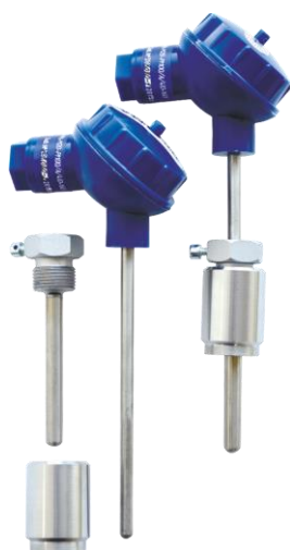
д) термопреобразователи сопротивления платиновые ТСП