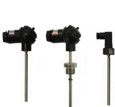
ж) термопреобразователи сопротивления платиновые ТСПТВХ