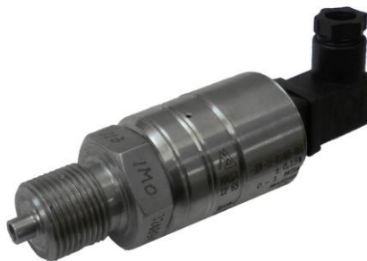
с) преобразователи давления МИДА-15