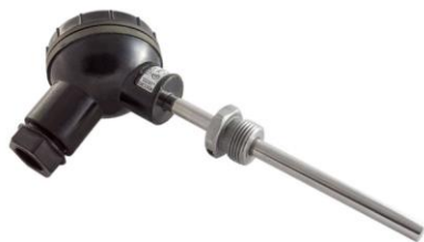
в) термопреобразователи сопротивления платиновые ТСП-Н