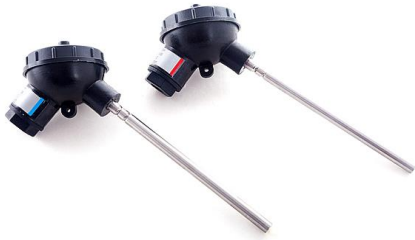
к) комплекты термопреобразователей сопротивления платиновых КТСПТВХ-В