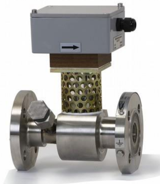
б) расходомер вихревой «Ирга-РВ», исполнение проходное