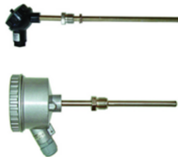
г) термопреобразователи сопротивления ТСП 012