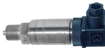
о) преобразователи давления МИДА-13П