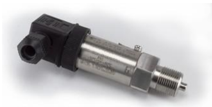
н) преобразователи давления измерительные СДВ