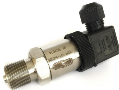
у) датчики избыточного давления с электрическим выходным сигналом ДДМ-03Т-ДИ