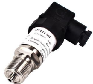
т) датчики давления МТ 101