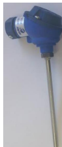
е) термопреобразователи сопротивления ВЗЛЁТ ТПС