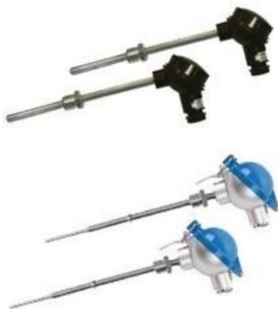
з) комплекты термометров сопротивления платиновых КТСП-1088, КТСП-1288